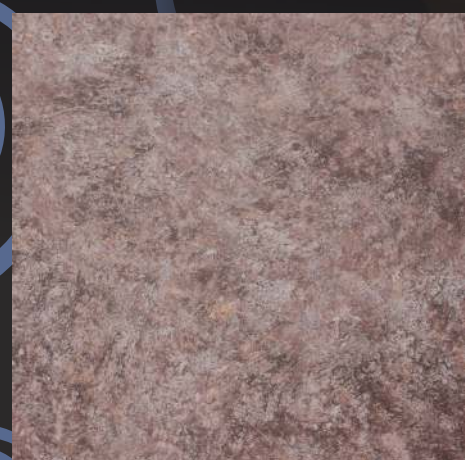
GWDC 03 baza COPPER