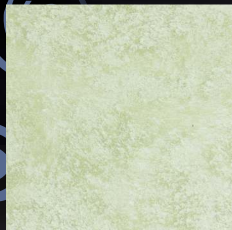
GWD 04 baza SILVER