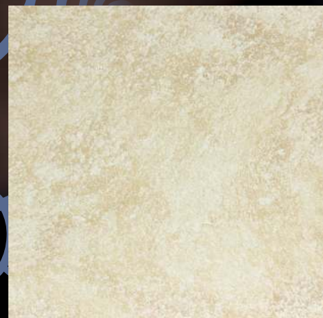
GWD 12 baza GOLD