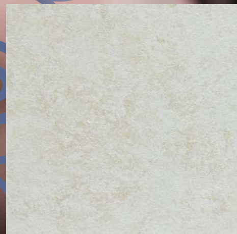
GWD 16 baza A